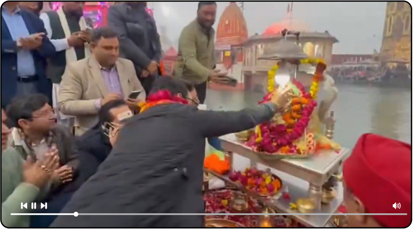
हरिद्वार में पुण्य सलिला माँ गंगा की आरती व पूजन-अर्चन