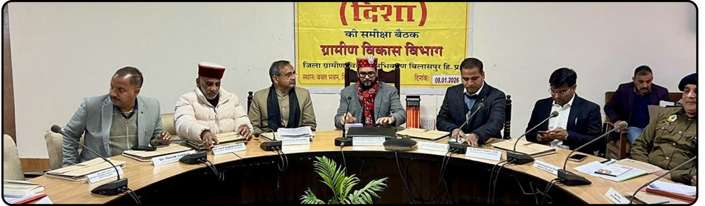
हमीरपुर लोकसभा अंतर्गत बिलासपुर स्थित बचत भवन में दिशा कमेटी की बैठक