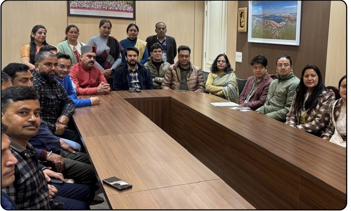
दिल्ली स्थित आवास पर प्रधानमंत्री श्री नरेंद्र मोदी जी के मासिक रेडियो कार्यक्रम मन की बात का श्रवण किया