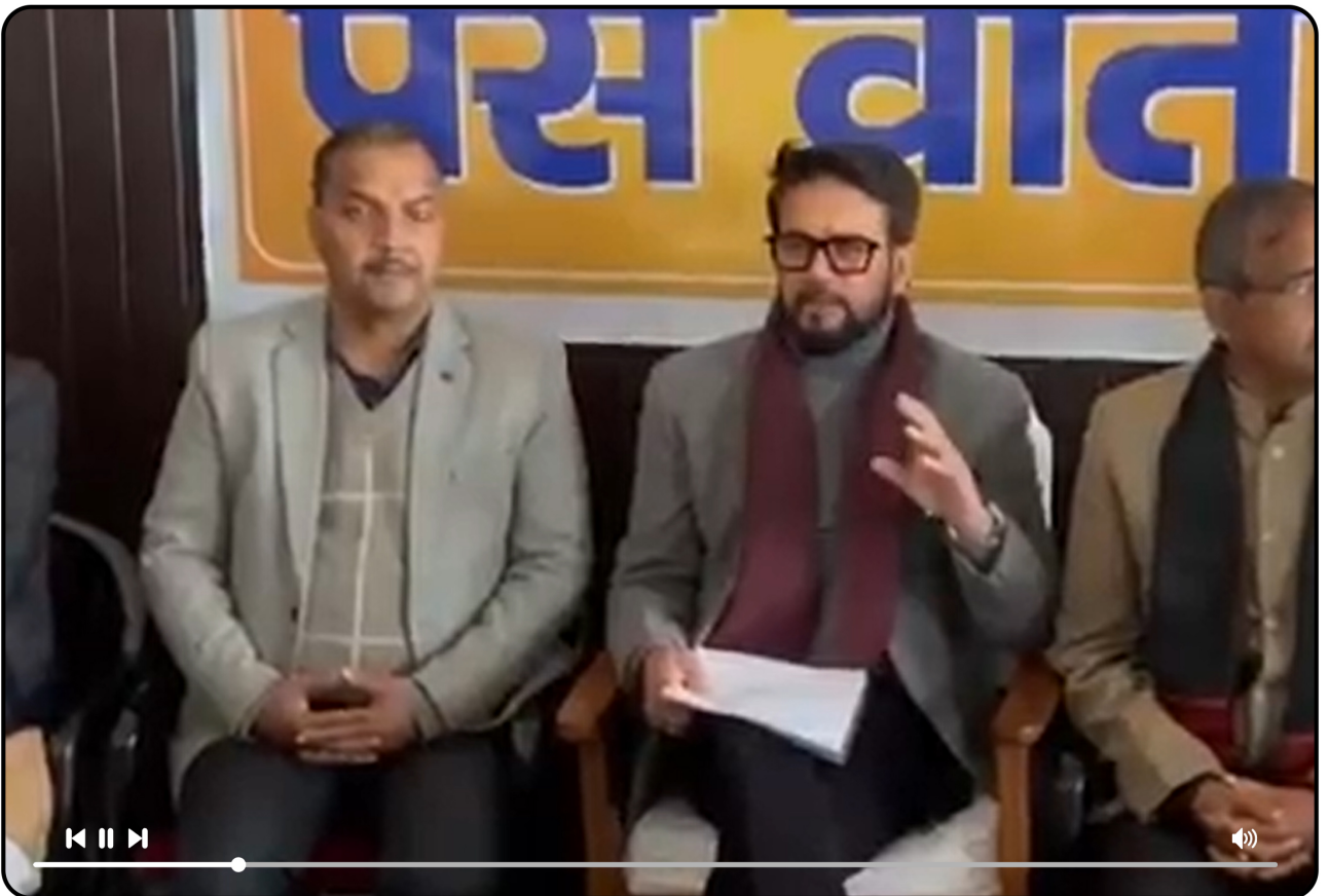
कांग्रेस द्वारा लगातार भगवान श्रीराम के नाम और गरीब कल्याण का विरोध किए जाने पर प्रेस वार्ता