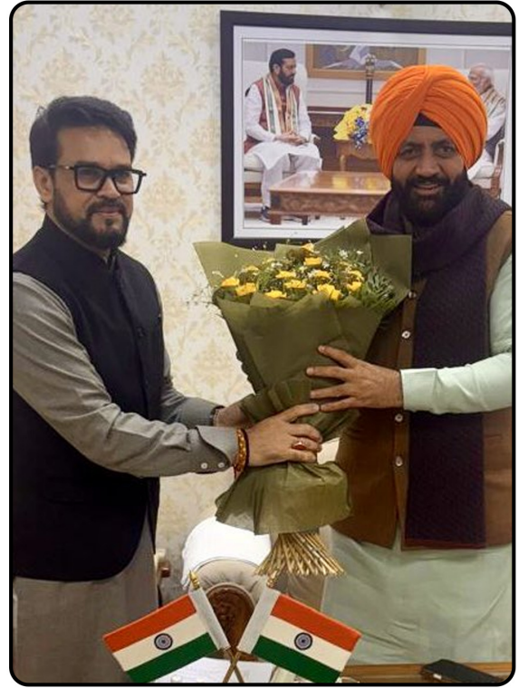
चंडीगढ़ में हरियाणा के लोकप्रिय मुख्यमंत्री श्री नायब सिंह सैनी जी से स्नेहिल भेंट