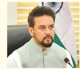
MP Anurag Singh Thakur

the underlying factors contributing to these events so that appropriate action can be taken for mitigation and future preparedness. The Ministry of Home Affairs, led by Union Home Minister Amit Shah, has taken steps in this direction by constituting a multi-sectoral Central team. This team will assess the situation across Himachal MP Anurag Singh Thakur Anurag Thakur highlighted