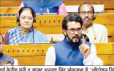
पूर्व केंद्रीय मंत्री व सांसद अनुराग सिंह ठाकुर ने 'ऑपरेशन सिद्ध' पर चर्चा में हिस्सा लेते हुए।

'ऑपरेशन सिद्ध' पर लोकसभा में चर्चा के दौरान भाजपा सांसद अनुराग सिंह ठाकुर ने विश्व पर तोखा हमला बोला। उन्होंने कहा कि राहुल गांधी अब Leader of Opposition नहीं, बल्कि Leader Opposing Bharat (LOB) बन चुके हैं। उनका कहना था कि राहुल गांधी को पाकिस्तान अपनी राजनीति में कवर फायर को दे रहे इस्तेमाल कर रहा है। अनुराग ठाकुर ने कहा कि 22 अप्रैल को पहलाम में 26 निर्दोष नागरिकों की हत्या के बाद भारतीय सेना ने सात मई को पाकिस्तान में घुसकर आतंकियों के 9 ठिकाने