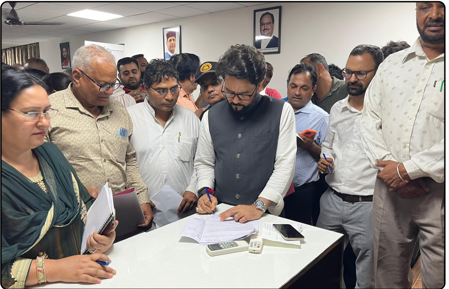
भारतीय जनता पार्टी कार्यालय ऊना में जनसमस्याओं की सुनवाई