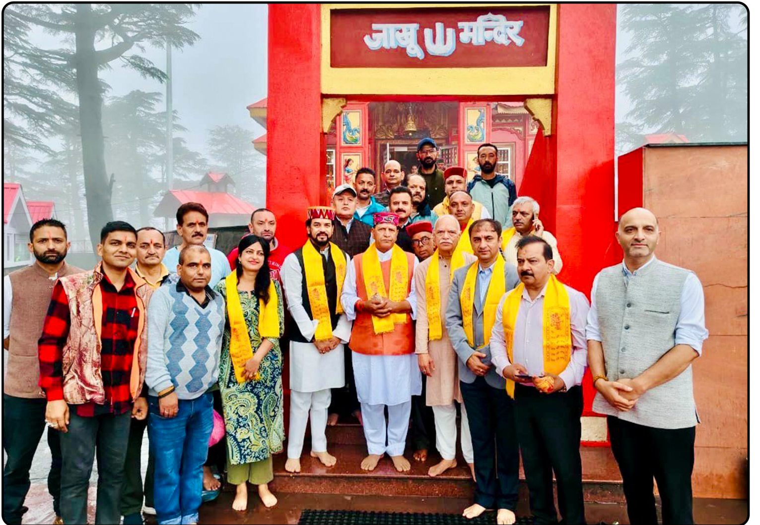
शिमला के जाखू मंदिर में प्रदेश अध्यक्ष एवं अन्य गणमान्यों के साथ हनुमान जी के दर्शन-पूजन