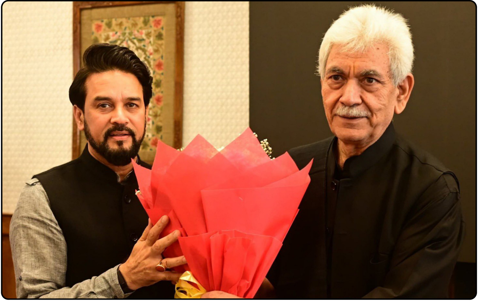
श्रीनगर प्रवास के दौरान जम्मू कश्मीर के उपराज्यपाल मनोज सिन्हा से मुलाकात