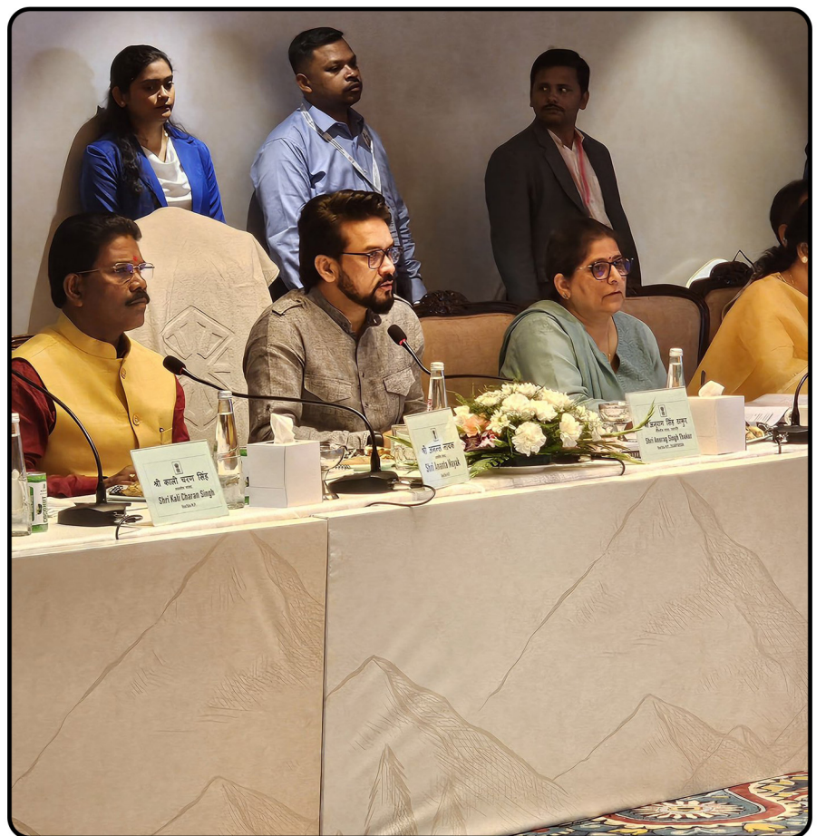
श्रीनगर में कोयला मंत्रालय, सीआईएल, एनसीएल और सीसीएल के प्रतिनिधियों के साथ बैठक