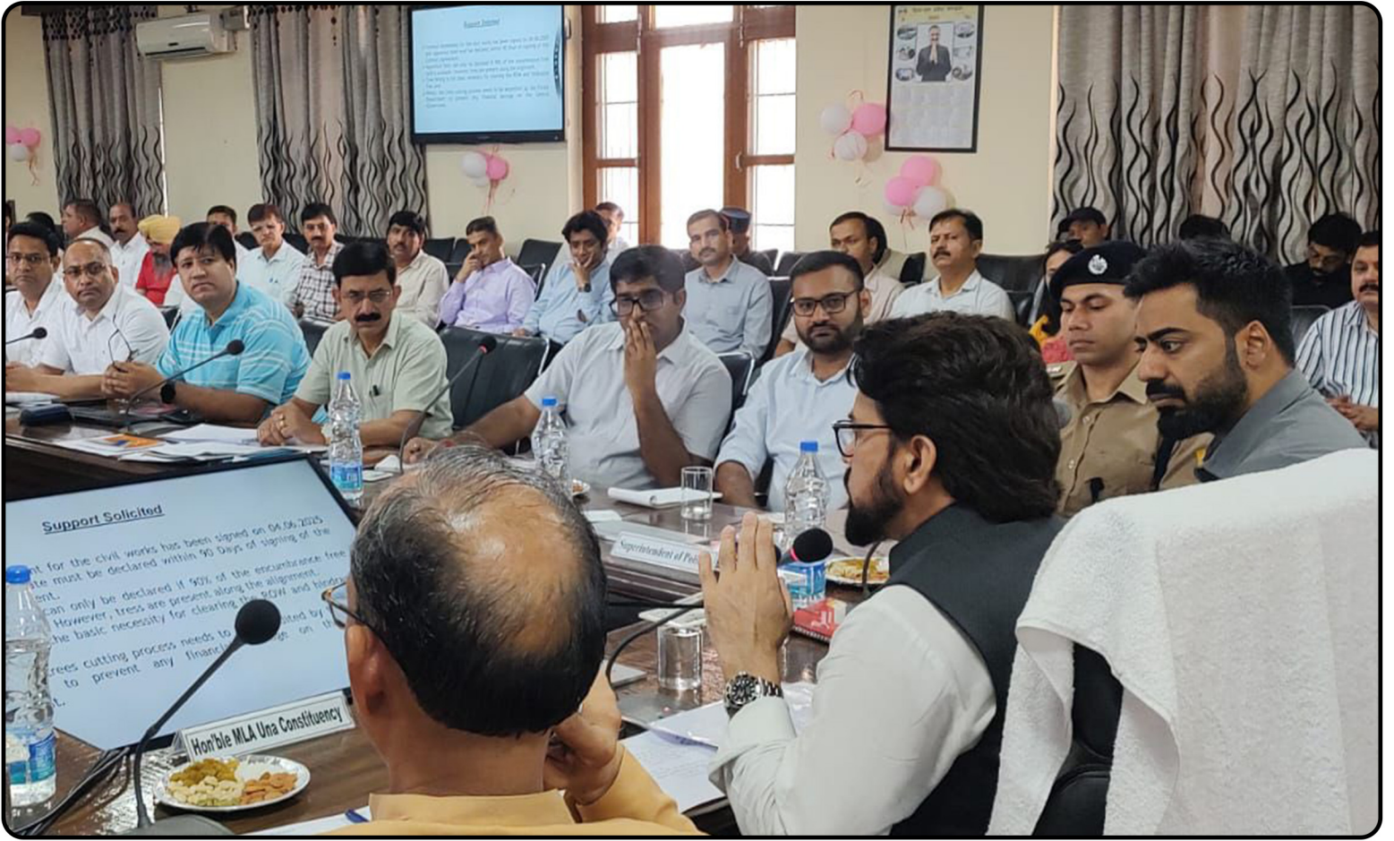
हमीरपुर संसदीय क्षेत्र के ऊना में जिला विकास समन्वय एवं निगरानी समिति (दिशा) की बैठक