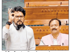
ईदिल्ली : संसद में अपनी बात रखते अनुराग ठाकुर।

■ कहा, निक्सन को लिखी चिट्ठी में आखिर इंदिरा जी क्यों गिड़गिड़ाईं