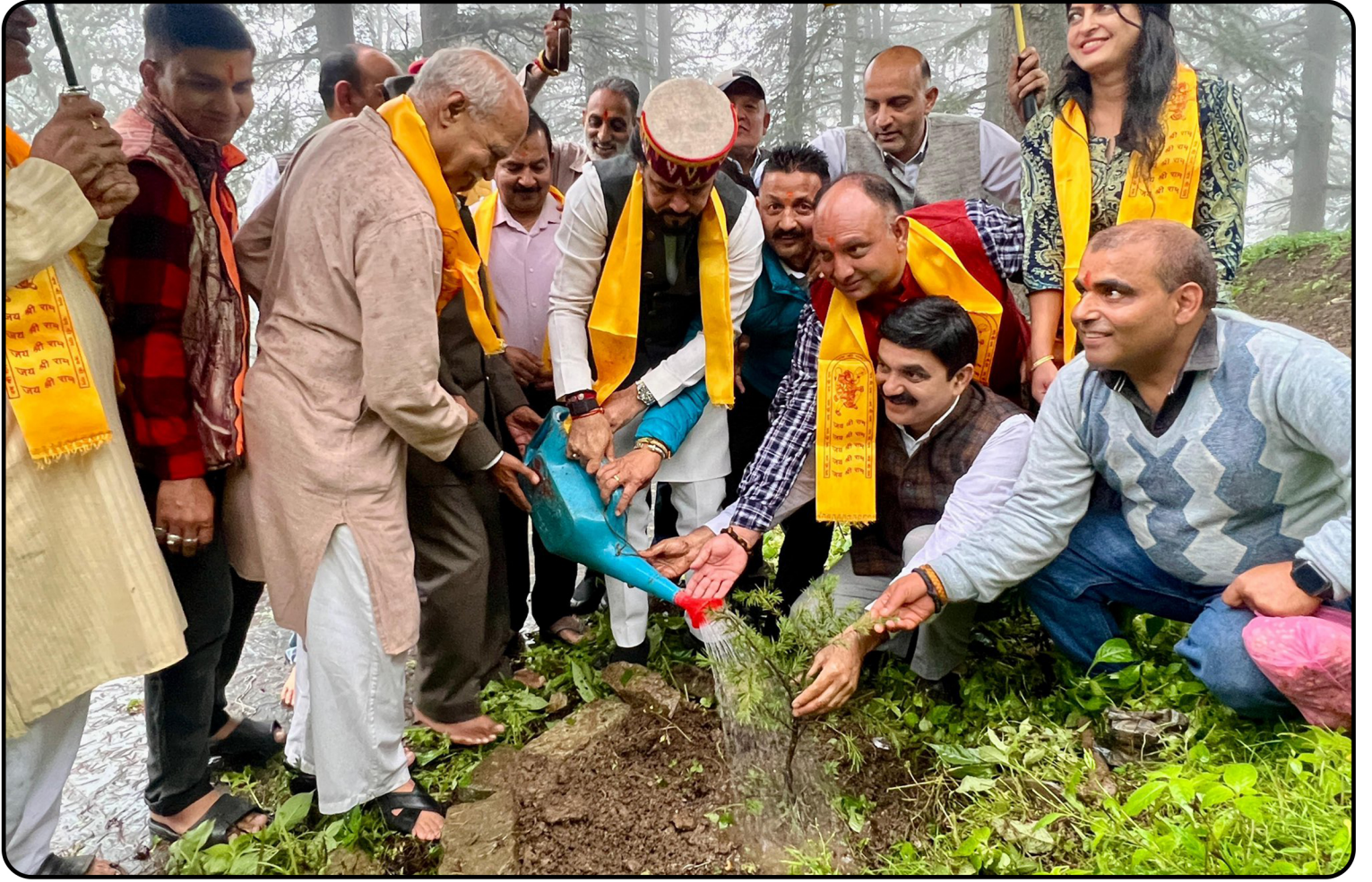
शिमला में जाखू स्थित हनुमान मंदिर परिसर में वृक्षारोपण