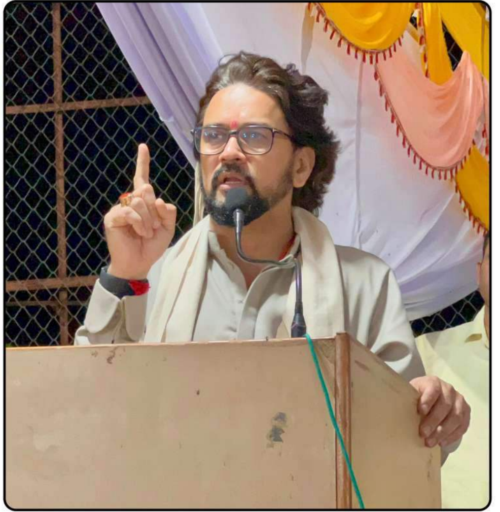
बिलासपुर की मोरसिंधी हैंडबाल अकादमी खेल मैदान में एलईडी फ़्लड लाइटों का लोकार्पण