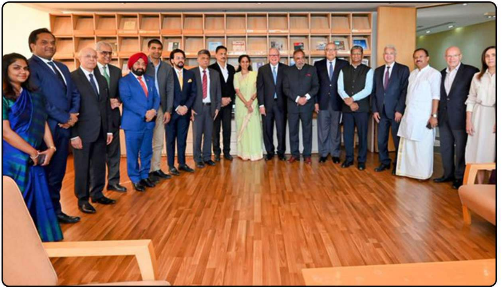
मिस्र की विदेश मामलों की समिति के साथ भारतीय प्रतिनिधिमंडल के सदस्य के रूप में मुलाकात