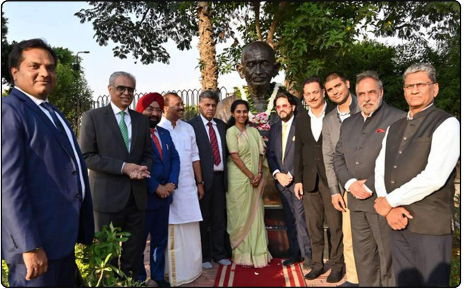
मिस्र की राजधानी काहिरा के जामलेक में स्थित महात्मा गांधी की प्रतिमा पर श्रद्धासुमन अर्पित किए