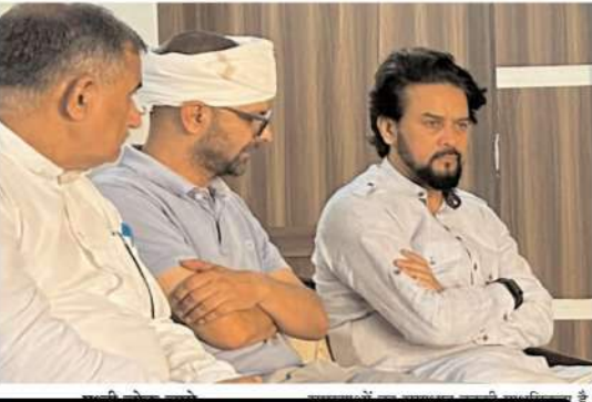
है। नता की कुर के के