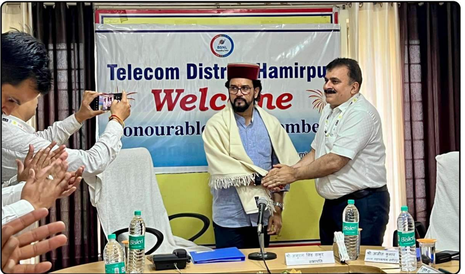
हमीरपुर में टेलीकॉम एडवाइजरी कमेटी की बैठक में अधिकारियों से चर्चा