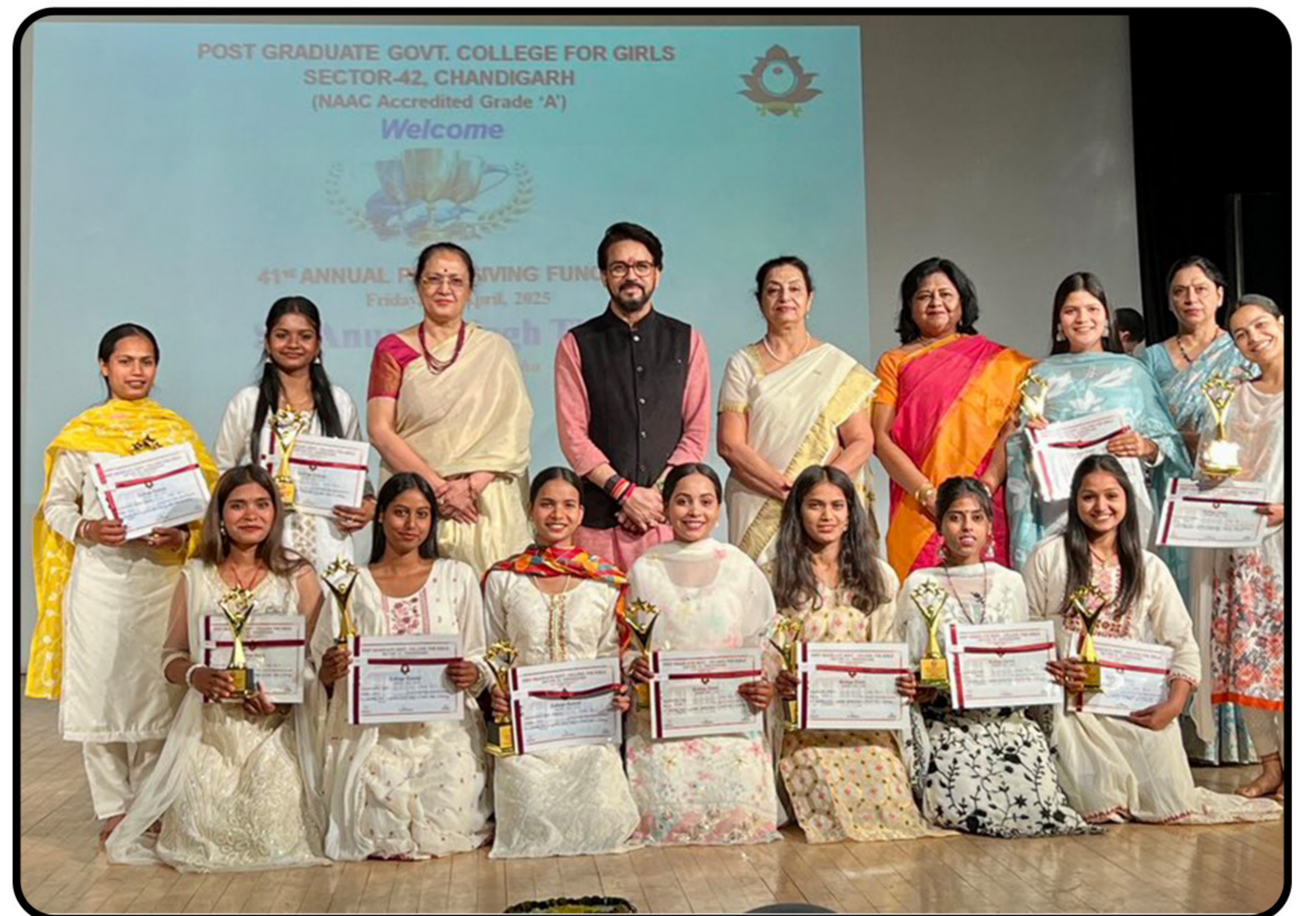
चंडीगढ़ के पीजी गवर्नमेंट कॉलेज फॉर गर्ल्स में 41वां वार्षिक पुरस्कार वितरण समारोह