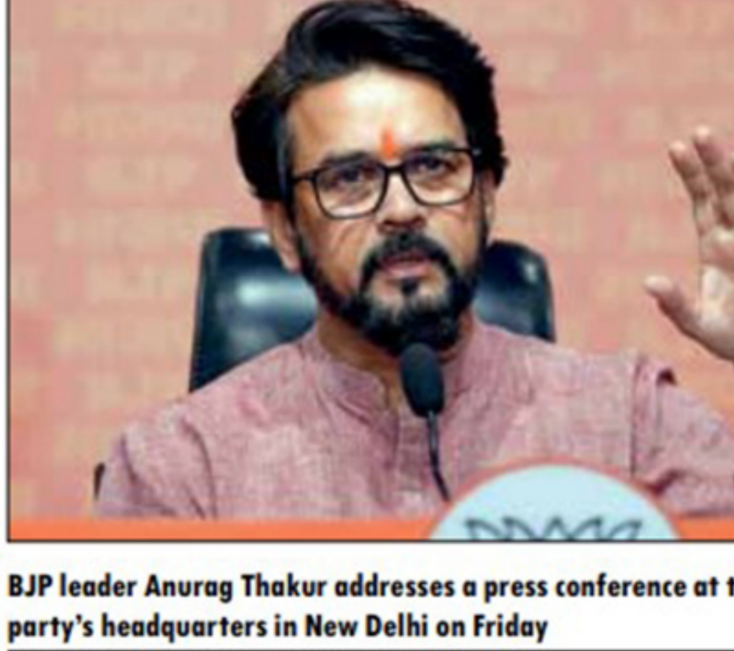
BJP leader Anurag Thakur addresses a press conference at the party's headquarters in New Delhi on Friday

NEW DELHI: The BJP on Friday dared Congress leaders facing corruption charges to seek a quick and time-bound disposal of cases, as it slammed the party for citing politics as the reason for the ED's action against Sonia Gandhi and Rahul Gandhi in the National Herald case.