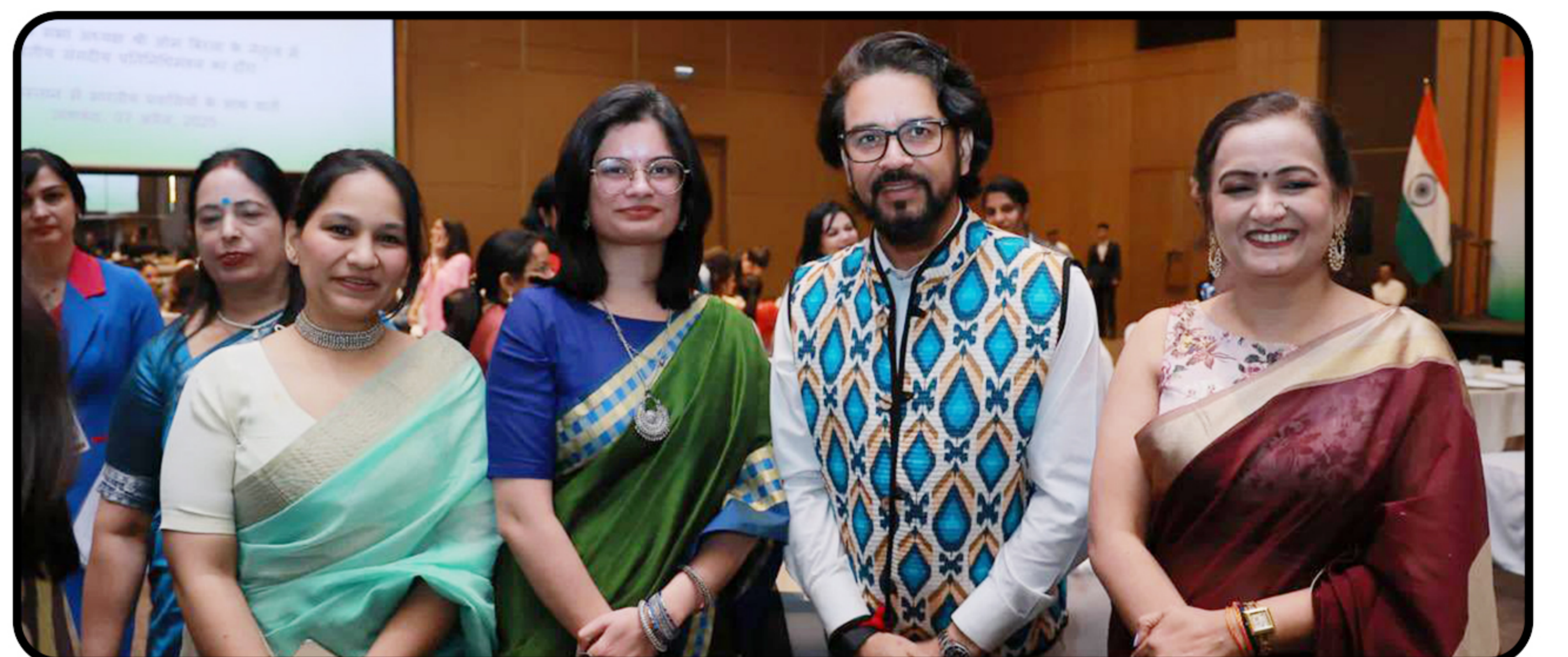
ताशकंद में भारतीय समुदाय के विभिन्न वर्गों के साथ भेंट-वार्ता