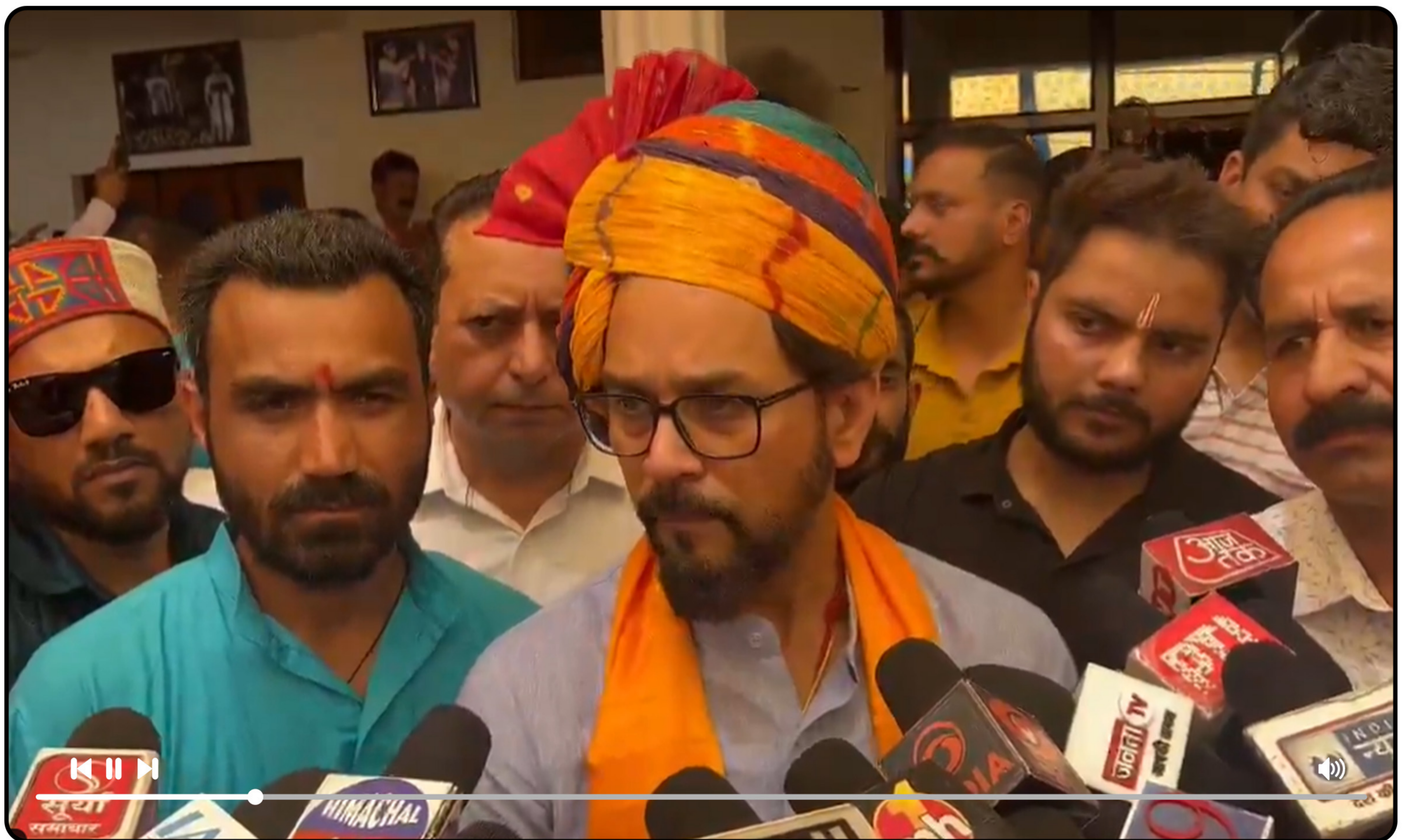
हिमाचल की जनता से वादाखिलाफी कर रही कांग्रेस सरकार के विषय में प्रेस से संवाद