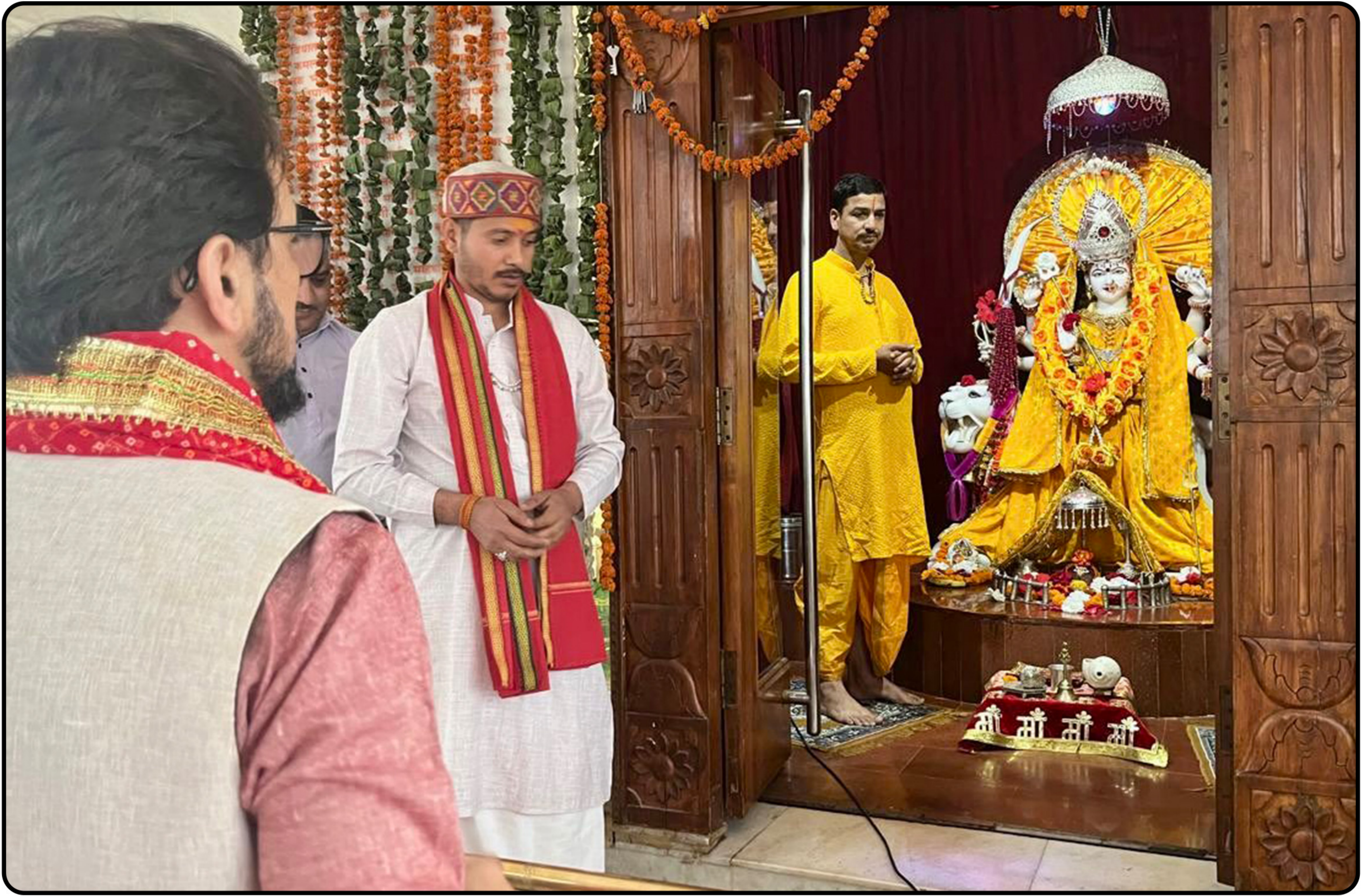
कुलदेवी जगतजननी माँ अवाहदेवी की आराधना कर सर्वकल्याण की कामना