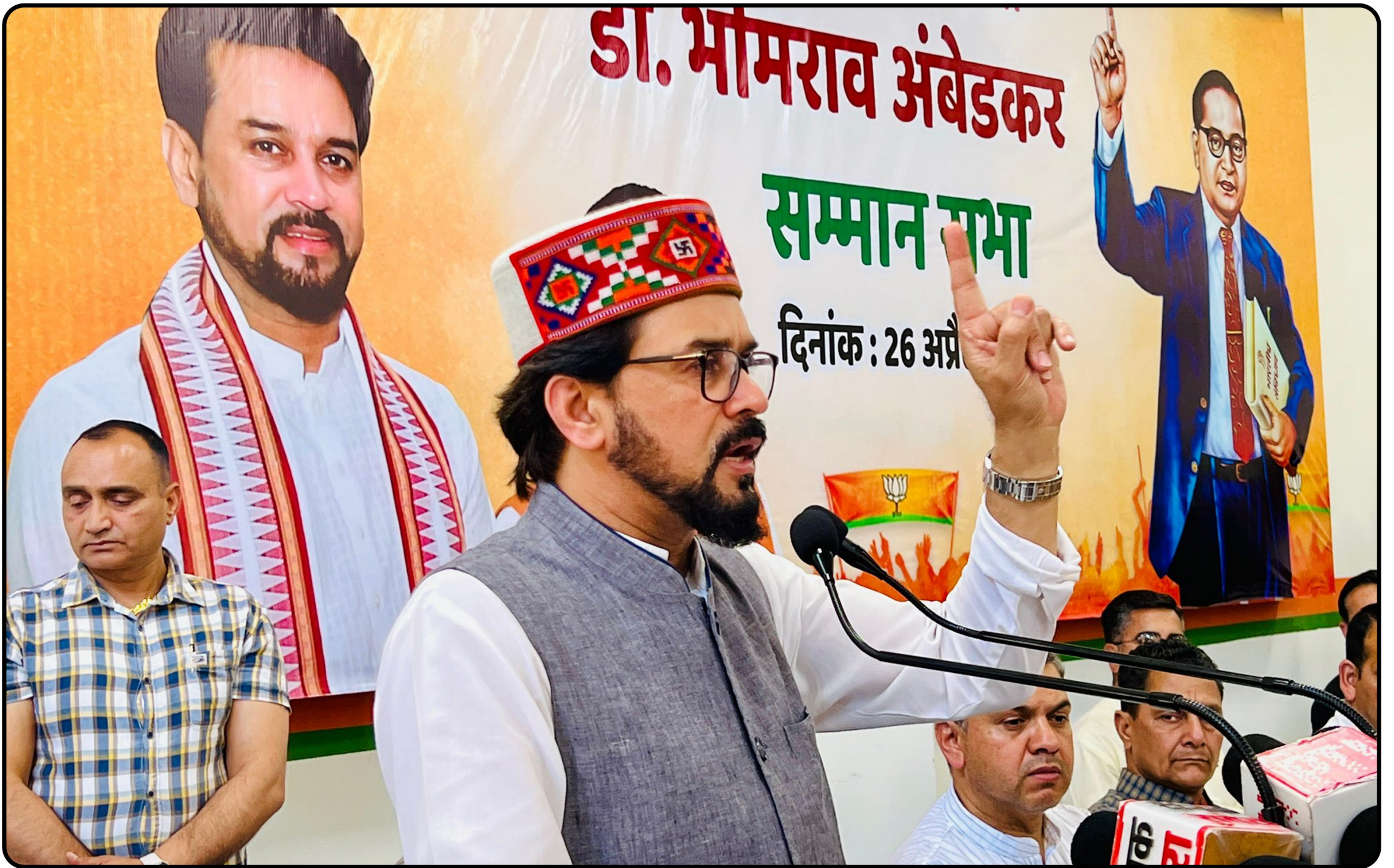
भाजपा द्वारा आयोजित डॉ. भीमराव अंबेडकर सम्मान अभियान के अंतर्गत मंडी जिले के सुंदरनगर में जनसभा