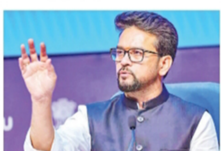
Bharatiya Janata Party (BJP) MP and former Union Minister Anurag Thakur

Thakur alleged that despite being unable to meet its own commitments to the people of Himachal Pradesh, the state government transferred crores of rupees to the National Herald between December 12, 2022, and