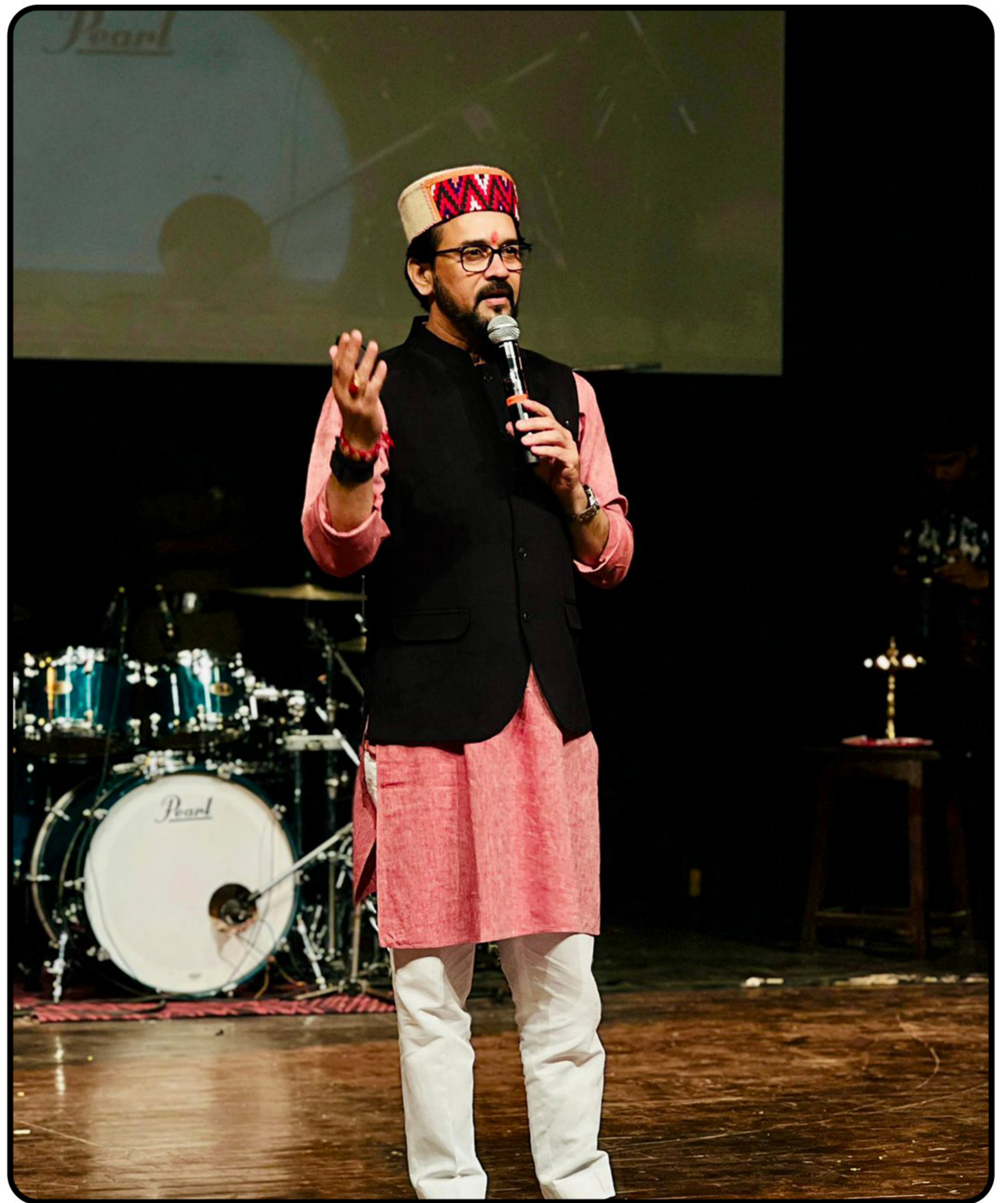
चंडीगढ़ में हिमाचल दिवस कार्यक्रम में अपने आत्मीय हिमाचली परिजनों से भेंट व संवाद