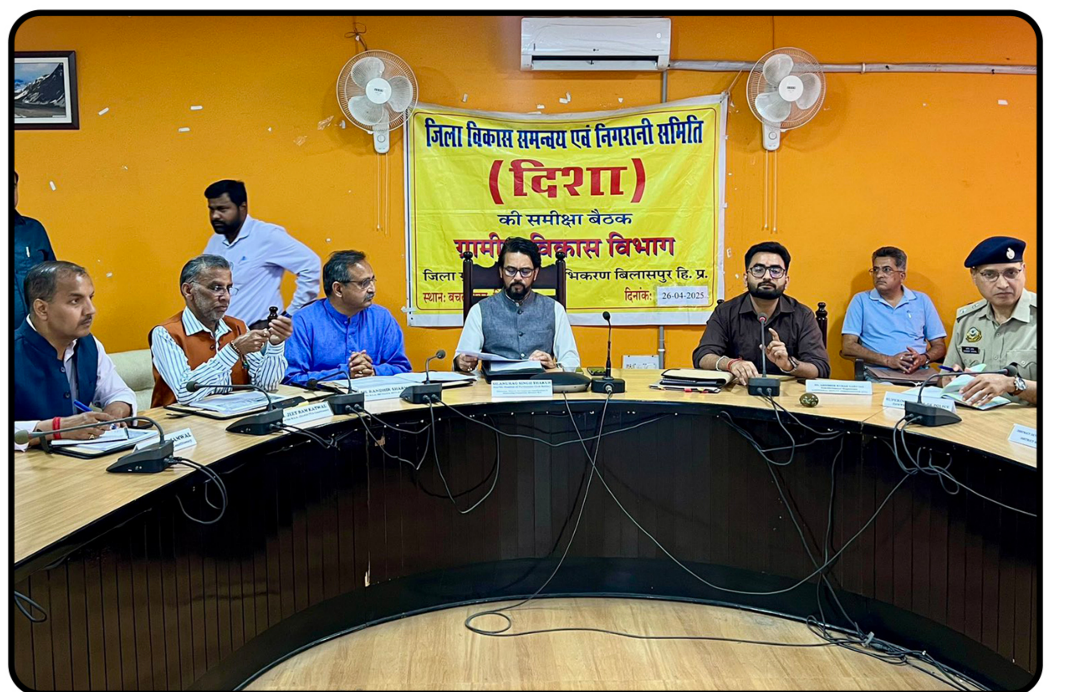
बिलासपुर में " जिला विकास समन्वय एवं निगरानी समिति " दिशा कमेटी की बैठक