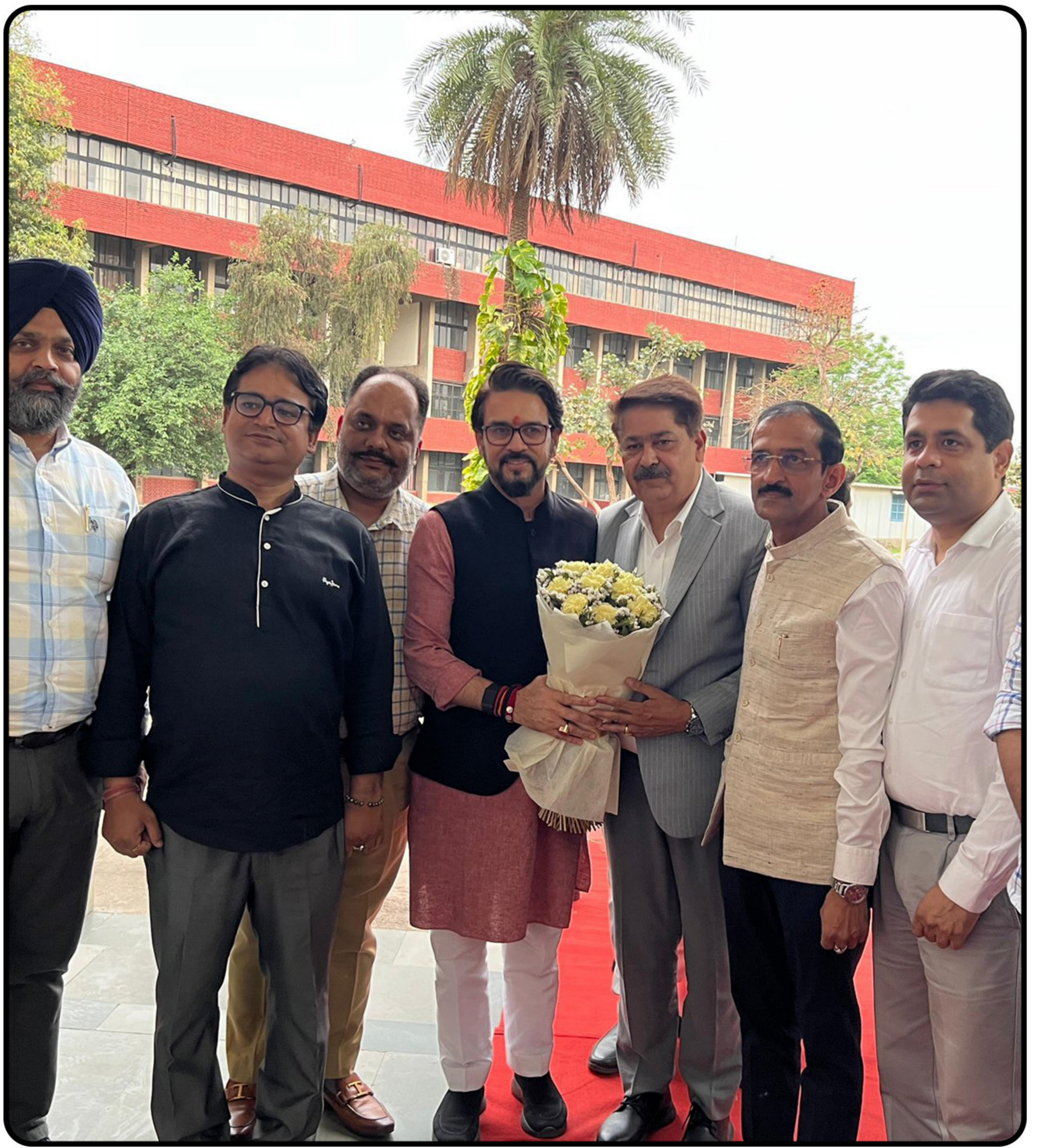
चंडीगढ़ में 'एक राष्ट्र, एक चुनाव' विषय पर आयोजित संगोष्ठी में प्रबुद्धजनों के साथ संवाद